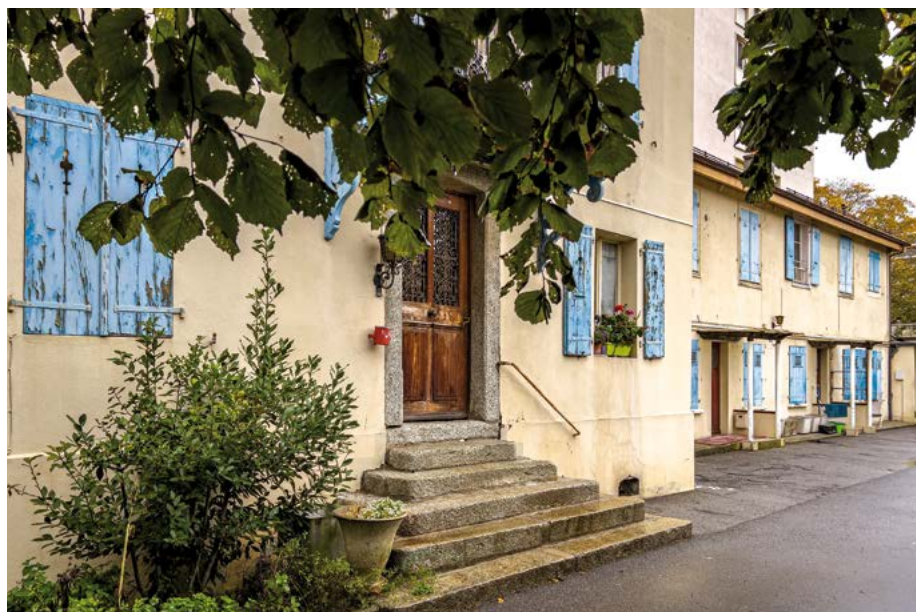
13A / 13B chemin Moïse Duboule

Aujourd'hui deux projets inquiètent l'Association des habitants du Petit-Saconnex. Le premier se situe au haut de la rue Pasteur, à l'angle du chemin de la Tourelle. la villa actuelle (parcelle 1935) va être détruite et deux bâtiments de deux et trois étages vont lui succéder. Si la hauteur des deux bâtiments ne suscite pas d'opposition, la question des places de stationnement est problématique. En effet, 9 appartements en loyers libres sont proposés avec seulement cinq places de stationnements en sous-sol pour les futures propriétaires. De plus, l'entrée du parking va entraîner la suppression d'au moins quatre places sur le domaine public. En d'autres termes, sur ce segment du chemin, une dizaine de places vont manquer pour les habitants qui y sont domiciliés. L'inquiétude de l'AHPTSG est accrue par le prolongement vraisemblable de ce bâtiment vers la place du Petit-Saconnex et la construction envisagée de deux nouvelles villas au chemin Pasteur - pour lesquelles aucun stationnement n'est prévu.