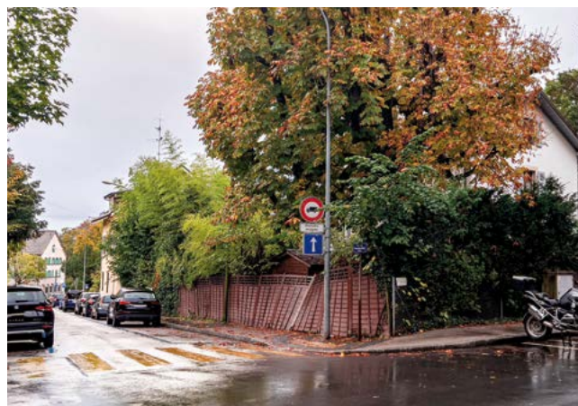
Rue Pasteur angle du chemin de la Tourelle.

Aujourd'hui deux projets inquiètent l'Association des habitants du Petit-Saconnex. Le premier se situe au haut de la rue Pasteur, à l'angle du chemin de la Tourelle. la villa actuelle (parcelle 1935) va être détruite et deux bâtiments de deux et trois étages vont lui succéder. Si la hauteur des deux bâtiments ne suscite pas d'opposition, la question des places de stationnement est problématique. En effet, 9 appartements en loyers libres sont proposés avec seulement cinq places de stationnements en sous-sol pour les futures propriétaires. De plus, l'entrée du parking va entraîner la suppression d'au moins quatre places sur le domaine public. En d'autres termes, sur ce segment du chemin, une dizaine de places vont manquer pour les habitants qui y sont domiciliés. L'inquiétude de l'AHPTSG est accrue par le prolongement vraisemblable de ce bâtiment vers la place du Petit-Saconnex et la construction envisagée de deux nouvelles villas au chemin Pasteur - pour lesquelles aucun stationnement n'est prévu.